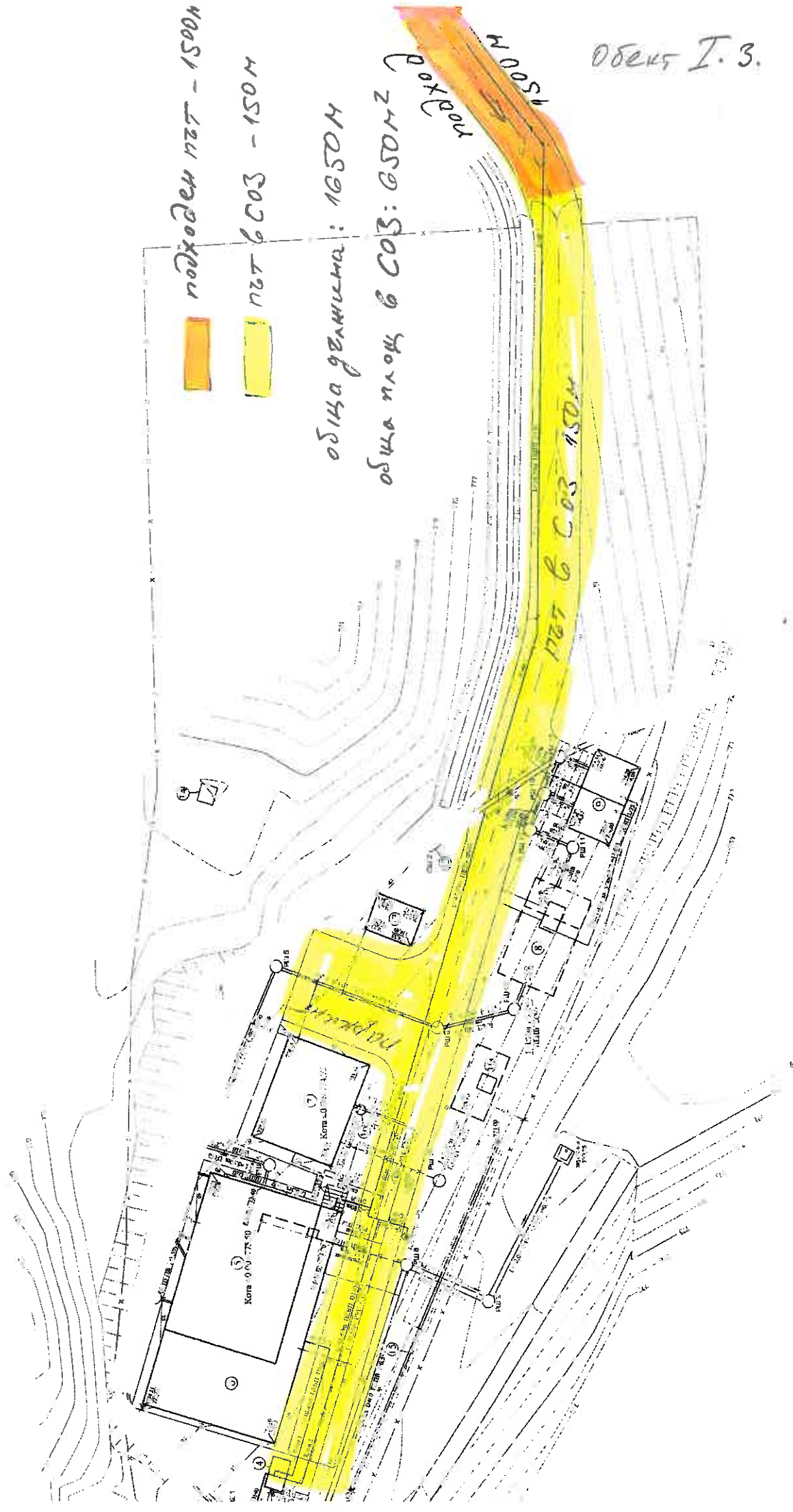
СХЕМА СЧЕГО ПОУЧЕСТВА НЕ